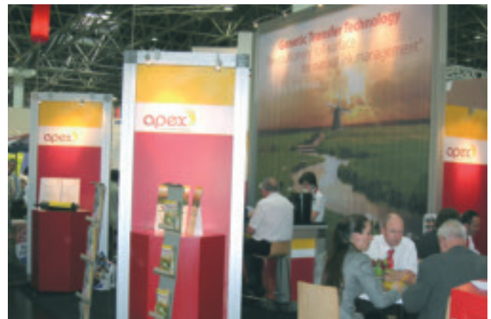
Abb. 1: Der Messestand von Apex während der Drupa 2008

The specialist manufacturers don't like to talk much about anilox rolls – a central element in flexo printing and in coating processes. The «secret» of a good anilox roller lies all too often in the right combination of material (ceramic), engraving technique (laser), cell form and surface roughness and finishing. The point is differentiation from the competition in every aspect. The ink dispensing behaviour is one of the most important quality criteria of an anilox roll. It is well-known that the conventional cell structures or tri-helical gravures have their process-technical and use-specific limitations. For this reason, the leading manufacturers of anilox rolls have repeatedly presented revised surface concepts in the past.